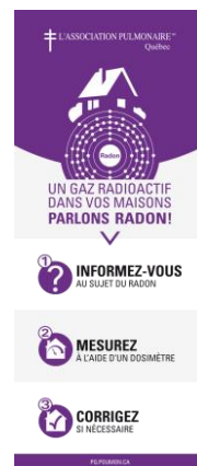
(4) Bannière déroulante sur support métallique rétractable, format 33'' x 80''