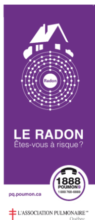
(1) Dépliant « Radon êtes-vous à risque? » 3,5'' x 8''